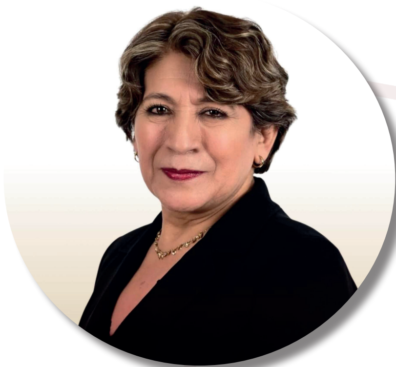
Mtra. Delfina Gómez Álvarez Gobernadora del Estado de México